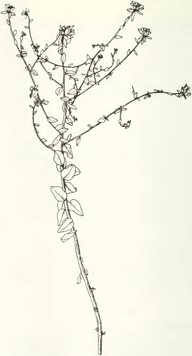
Abb. 1: Reaumurea halophila Podlech (PODLECH 11433) ca. 2/5 nat. Größe